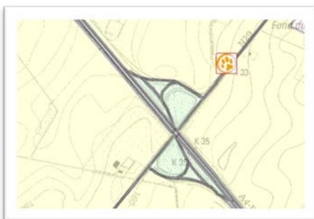
Cartographie des refuges Unique refuge dans un rayon de 25km